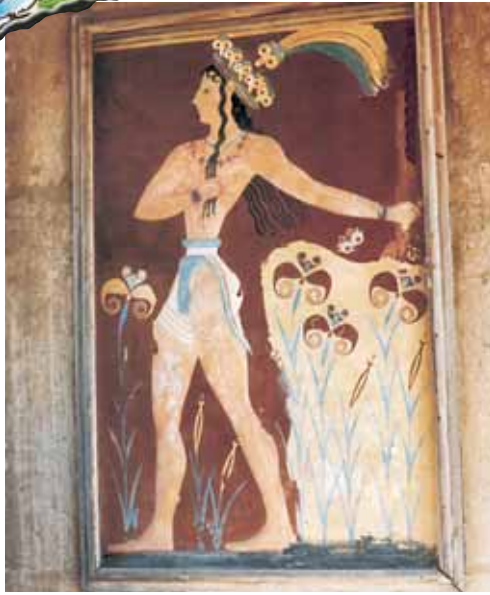
Principe dei gigli, palazzo di Cnosso (XVII - XV sec. a.C.)