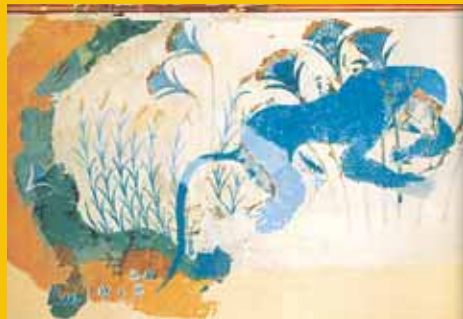
Scimmia azzurra, affresco, Cnosso (XVII - XV sec. a.C.)

Strappa la carta riso e riducila in striscioline irregolari; diluisci la colla vinilica con un po' d'acqua, quindi con il pennello stendi un sottile strato di colla sul vasetto e attacca sopra le striscioline di carta riso. Passa un altro strato di colla sulla carta e lascia