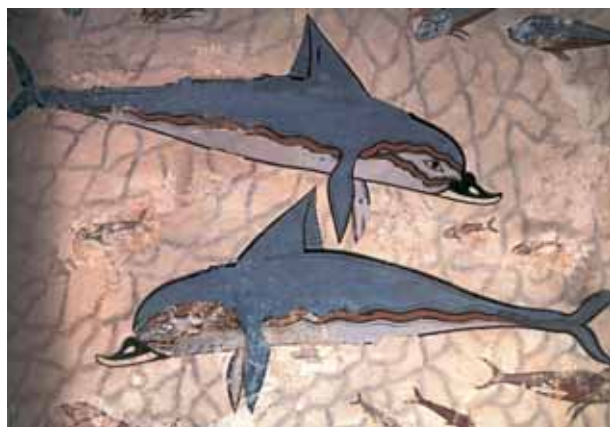
Delfini, affresco, palazzo di Cnosso (XVII-XV sec. a.C.)

Con il passare del tempo l'Uomo sentì la necessità di stare insieme agli altri, di riunirsi in gruppi sempre più numerosi e pian piano nacquero le prime civiltà. Ognuna di esse ci ha lasciato numerose tracce del proprio passaggio: monumenti, costruzioni, sculture, pitture che ci hanno permesso di ricostruire la loro storia, le abitudini, gli usi.